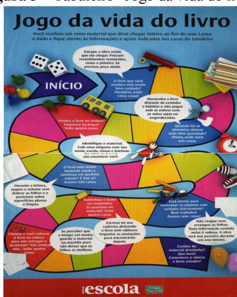
Figura 3 – Tabuleiro “Jogo da vida do livro”