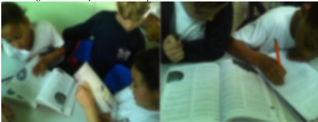
Figura 2 – Utilização de dicionários pertencentes ao acervo da biblioteca da escola

(A utilização do efeito desfoque na foto objetivou a não identificação dos participantes)